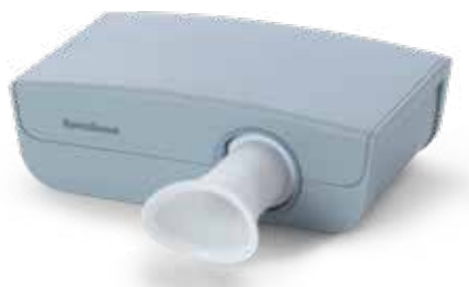
Ultraschall-Spirometer SpiroScout SP plus