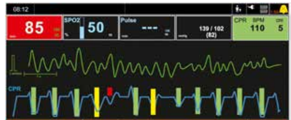
Assistance à la RCP par code couleur grâce à l'ARGUS LifePoint

* Phase de décompression active non disponible au Royaume-Uni, en France, en Allemagne et aux États-Unis.