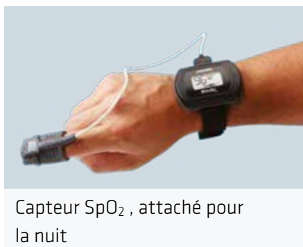
Capteur SpO 2 , attaché pour la nuit

Grâce à l'enregistrement de la respiration 2 dérivé de l'ECC, le medilogAR est en mesure de détecter d'éventuels épisodes respiratoires pendant le sommeil. Le capteur SpO 2 2 facultatif, connecté via Bluetooth, permet d'obtenir plus d'informations relatives à la respiration.