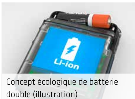
Concept écologique de batterie double (illustration)

Grâce au concept de batterie double, les patients peuvent être suivis