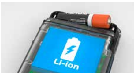
Umweltfreundliches Doppelbatteriekonzept (Abbildung)

Dank dem Doppelbatteriekonzept kann der Patient mehr als 14 Tage überwacht werden, ohne dass der Arzt die Batterien wechseln muss.