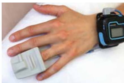
SpO 2 -Sensor, zur Messung nachts

Dank der Aufzeichnung des vom EKG abgeleiteten Atmungsaktivitätssignals sucht der medilog®AR nach möglichen Unterbrechungen der Atmungsaktivität während des Schlafs. Der optionale SpO 2 -Sensor bringt zusätzliche Information zur Atmungsaktivitätsbewertung und wird via Bluetooth verbunden.