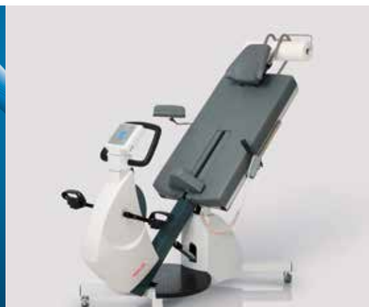
ERG 911 L: ergometro di sicurezza con lettino/schienale, infinitamente variabile da 0° - 45°