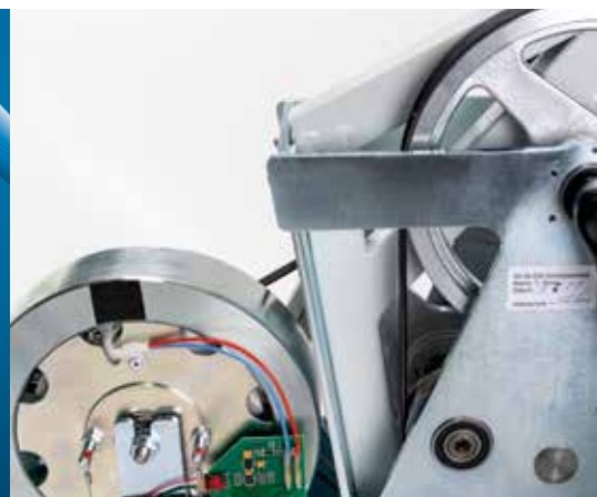
Im Innern: optimale Schwungmasse und Riemenantrieb

Die Ergometer ERG 910 plus und ERG 911 plus wurden für die Kardiologie entwickelt. Dank der Stahlrohrkonstruktion sind sie äusserst stabil. Somit sind sie für Patienten bis zu 160 kg geeignet, mit Kippsicherung (optional) sogar bis zu 200 kg. Die Ergometer sind kompakt und beanspruchen eine minimale Grundfläche.