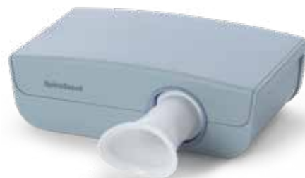
Spiromètre à ultrasons SpiroScout SP plus

L'option spirométrie propose des mesures CVF, CVL et VMM avec un large choix de normes de référence, de tests préalables et postérieurs ainsi que l'interprétation des résultats CVF. L'appareil fournit un feed-back sur la qualité de la procédure pendant le test et après chaque essai. Un écran de motivation est inclus pour les tests avec des enfants.