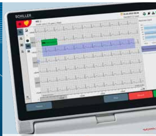
Mit ECG Framer 10-sekündiges Ruhe-EKG aus Ruhe-Rhythmus erstellen (Rhythmusdauer bis 20 Minuten)