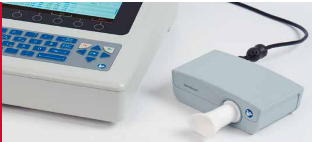
SpiroScout SP plus, per test di spirometria con il CARDIOVIT AT-102 G2